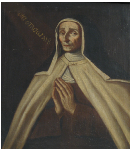
Venerabile Madre Serafina di Dio Tela dal duomo di Capri