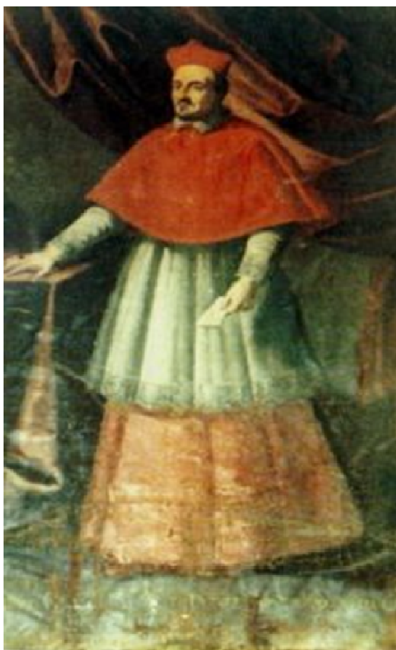
Cardinale Innico Caracciolo